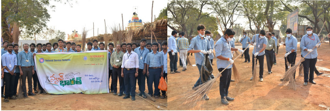
Clean the temple Surrounding area at Quarry Vadlamudivillage.