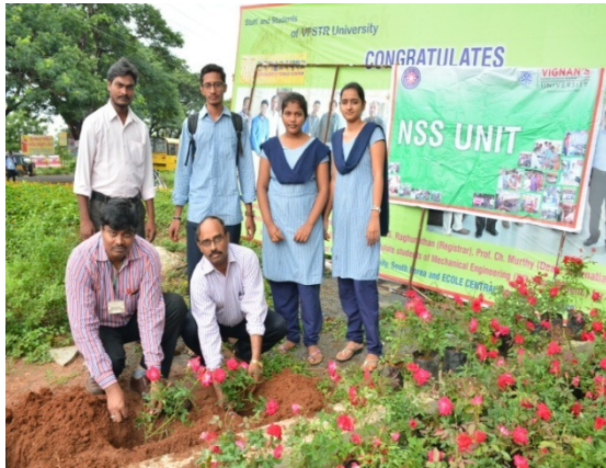
Tree plantation program

On the occasion of NSS day we would like to organize some service oriented programmes in university premises and adopted villages. The events are: 1.Tree plantation program is conducted at the main gate Vignans University on 23.09.2016. The Second event is with respect to request from ENDO LIFE hospital; to organize the free Diabetic screening camp on 24 th September 2016 in our adopted village Veeranayakunipalem to improve the overall awareness and preparation on how to deal with Diabetic problems. The Third event is books distribution at ZPH School vegendla village on 24.09.2016. And the fourth event is we request Dr. Rajesh ophthalmologist on Eye donation awareness camp in the University premises on 24.09.2016.