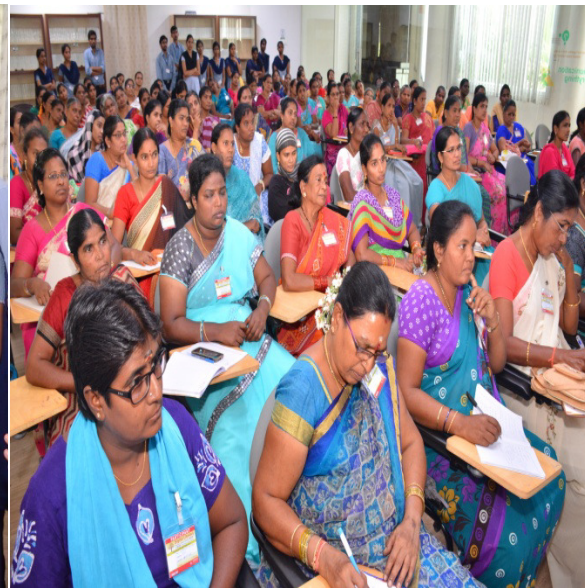
SHG women RPs in training program