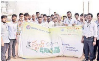
స్వచ్ఛభారత్ లో పాల్గొన్న విజ్ఞాన్ విద్యార్థులు