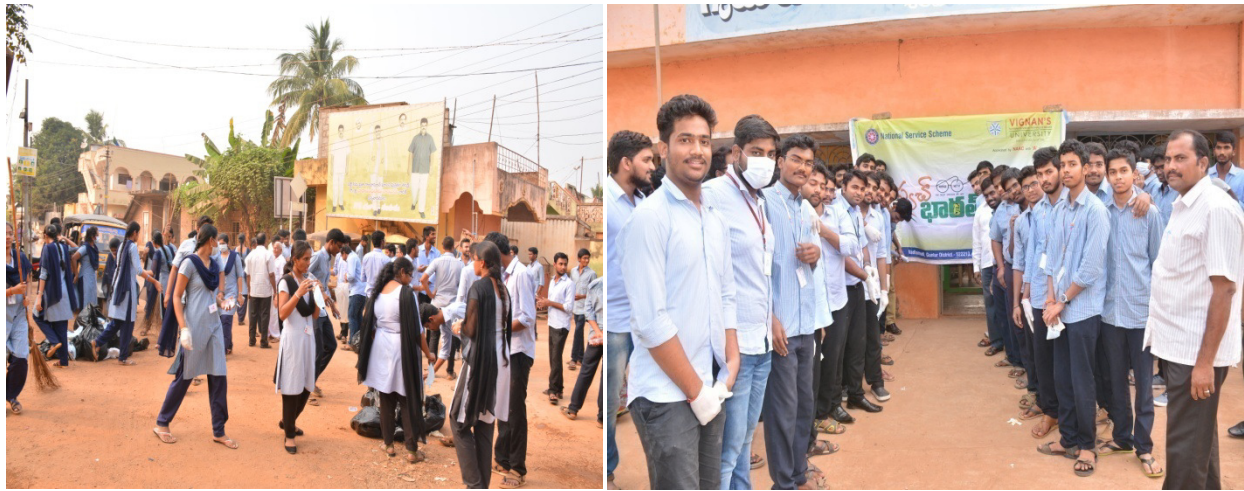
Cleanthe School and gram panchayathbuilding surroundingsat Selapadu village.