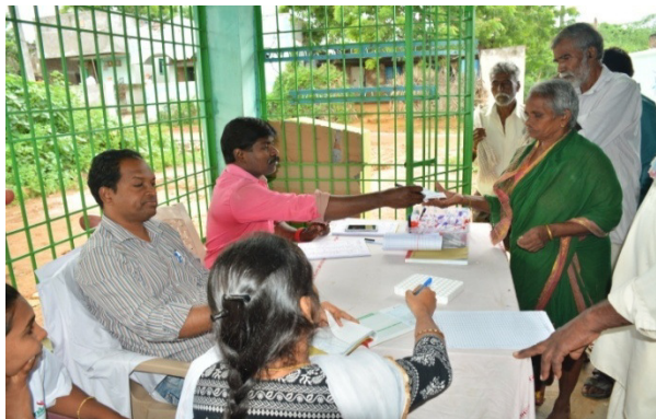
Free diabetic Awareness camp