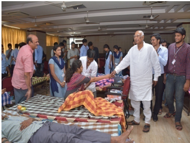
Sanskriti seminar Hall

There was high enthusiasm among students and faculty members to be a part of this noble mission on the legend's birthday. More than 472 students of all the years and some faculty members donated blood. 2 doctors, six pathologists were supervising this particular camp. The NSS coordinators rendered their services for making it a grand success.