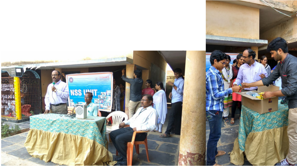
Providing Snacks and distributing fruits for 10 th class students during the public examination (17.03.2017 to 01.04.2017).

As a part of NSS activities, the NSS Unit of Vignan's University have been providing nutrition food as snacks to the X class students in evening times at adopted schools for last 3 years. In this academic year also, HM of Vegandla requested us for provision of snacks & fruits for X class students at evening times for effective preparation of examinations (17.03.2017 to 01.04.2017). Our NSS Unit has been visiting ZPH School Vegandla for providing Snacks and distributing fruits for 10 th class students during the public examination. This event continues until end of the examinations. And the Head Master of ZPHS Vegandla requested our university to provide 2 buses for their 124 students to and fro from school in Vegandla to ZPHS, narakoduru examination center this transport services to this school has been providing by last five years.