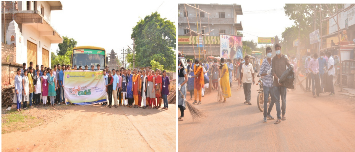
Cleaning Main road in Vadlamudi village