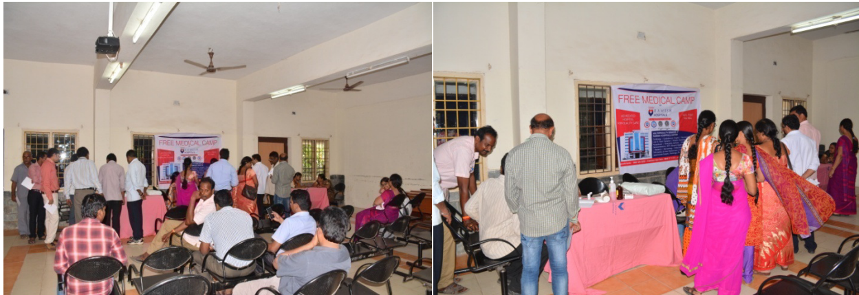
Teaching and Non teaching staff