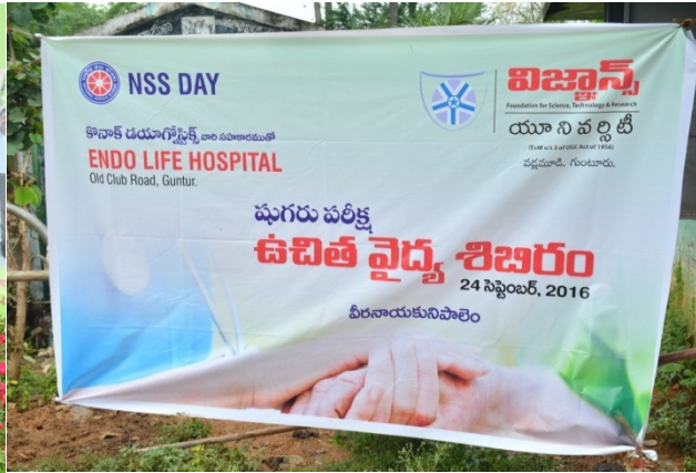
Free Diabetic Awareness Camp