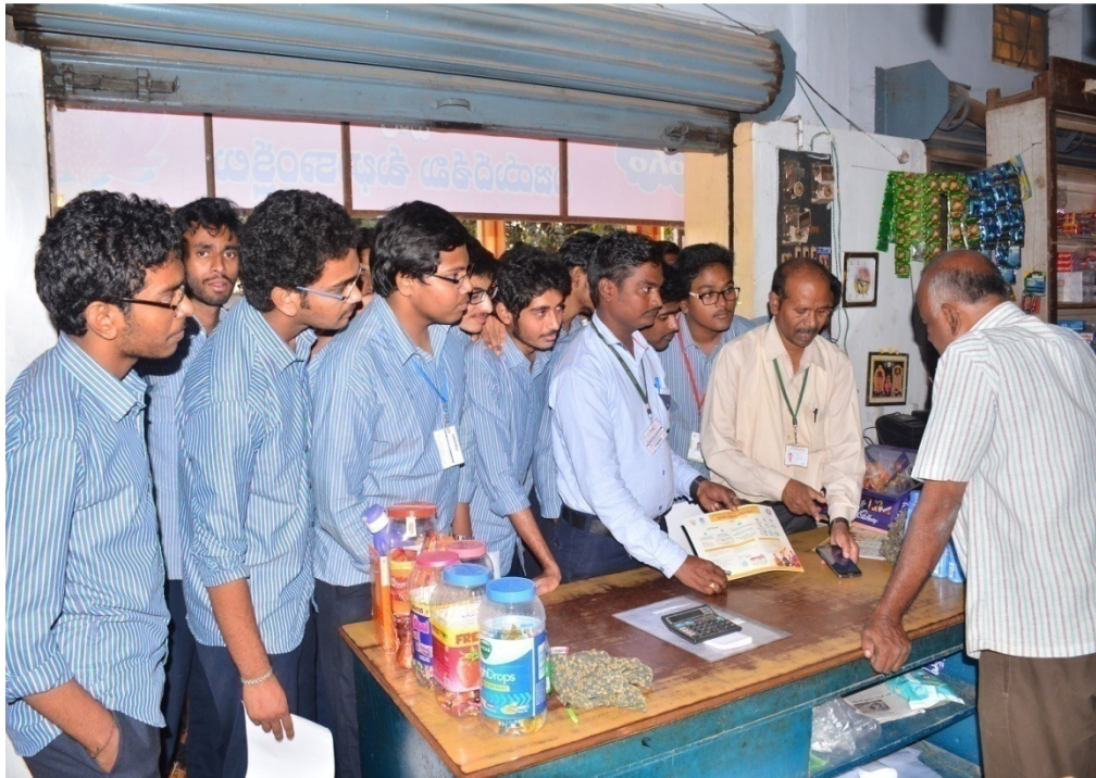
Educating the villagers in Vadlamudi villager regarding digital payments on 6 th January 2017.