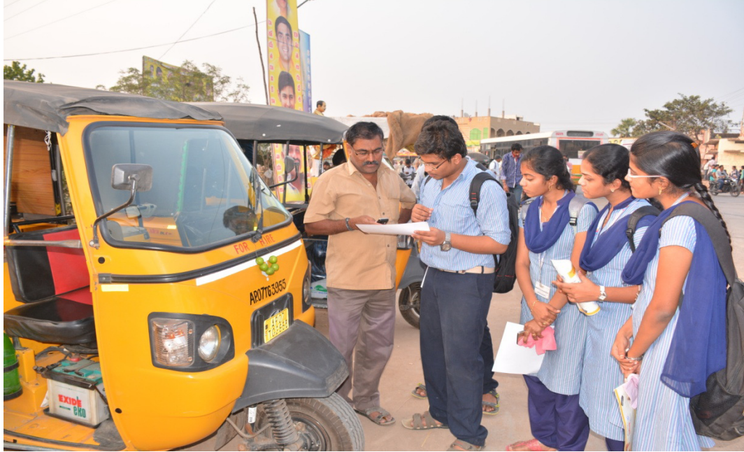
In Narakoduru village educateddrivers of Auto rickshaw about cashless transactions.