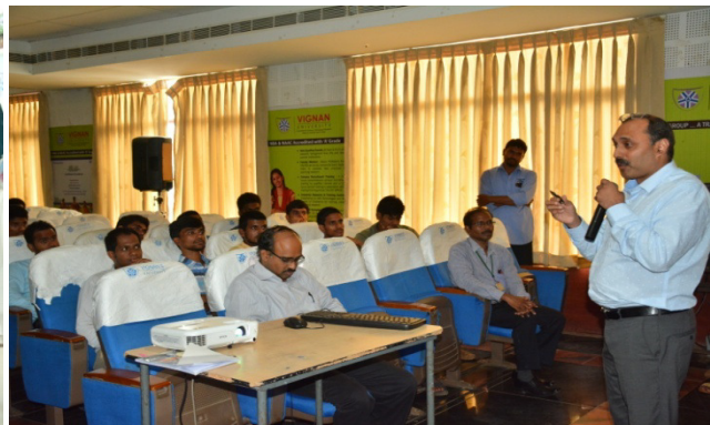
Eye Donation Awareness Camp